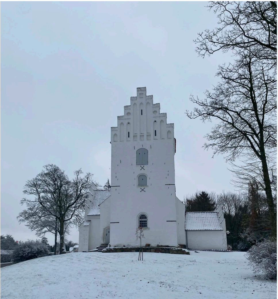
Tommerup kirke sneklædt i slutningen af november.