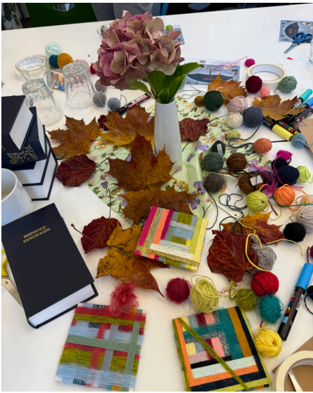
Eksempler på nogle af de flotte viklebilleder der blev skabt.